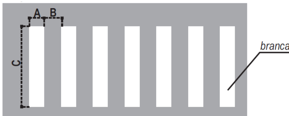
Detalhe Faixa Tipo Zebrada.