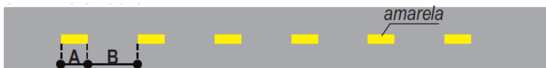
Detalhe Faixa Seccionada.